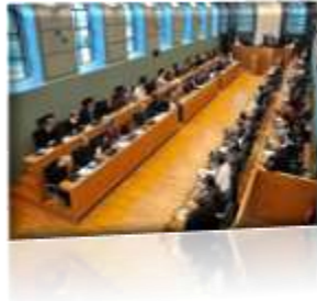
Parlement Wallon (Namur)