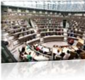
Parlement Flamand (Bruxelles)