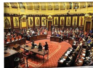
Maison des Parlementaires (Bruxelles)