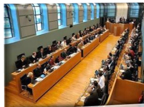
Parlement Wallon (Namur)