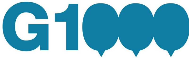
PLATE-FORME D'INNOVATION DEMOCRATIQUE