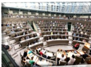
Parlement Flamand (Bruxelles)