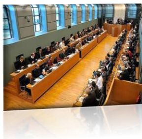
Waals Parlement (Namen)