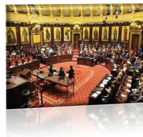
Huis der Parlementsleden (Brussel)