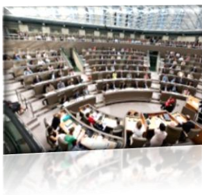
Vlaams Parlement (Brussel)